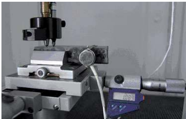
Rys. 2. Sensor EA umieszczony przy bocznej powierzchni próbki betonowej

Do rejestracji sygnału EA stosowano piezoelektryczny przetwornik emisji akustycznej WD (produkcji firmy PAC, USA) o czułości 1 mV/mikrobar, zamocowany na bocznej powierzchni próbki (rysunek 2). Sygnały przekształcane były przez układ jednocanałowego analizatora emisji akustycznej o wzmocnieniu 60 dB. Korzystano z karty ultraszybkiej akwizycji danych PCI-9812, o rozdzielczości 12 bitów, i częstotliwości próbkowania sygnału 1 MHz. W karcie akwizycji danych sygnał EA przetwarzany był na postać binarną i zapisywany na dysku komputera.